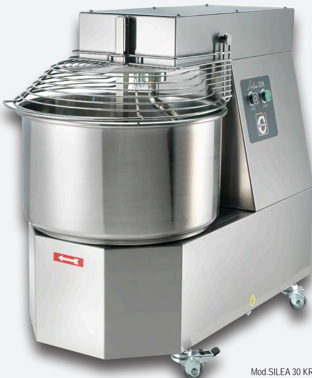
Mod.SILEA 30 KR